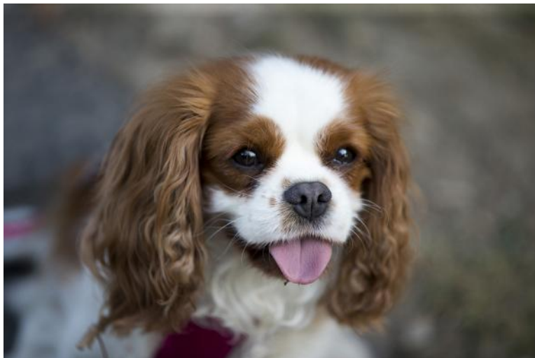
(Dolly, Adoptada 25/04/2015 - 01/06/2016)